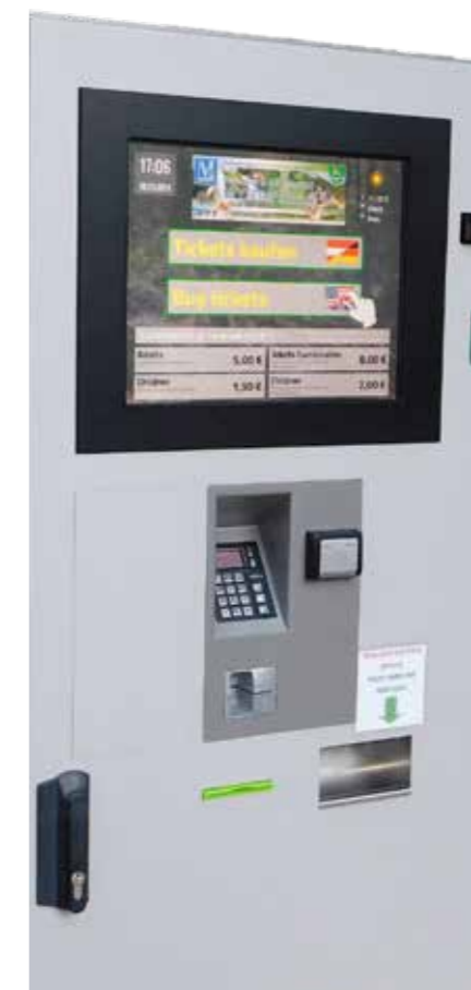
Universeller Self-Service-Kassenterminal für Ticket- und Parkticketverkauf und die Buchung/Umbuchung der Reservierungen.

Um eine Komplettlösung anbieten zu können, wurde zudem auch ein robuster Scanner für den Innen- und Außenbereich entwickelt. Als innovative Neuheit dient die individuell an die betrieblichen Erfordernisse anpassbare Bedienoberfläche, mit der eine optimale audiovisuelle Interaktion mit den Besuchern ermöglicht wird, und die zusätzlich für Marketingzwecke genutzt werden kann.