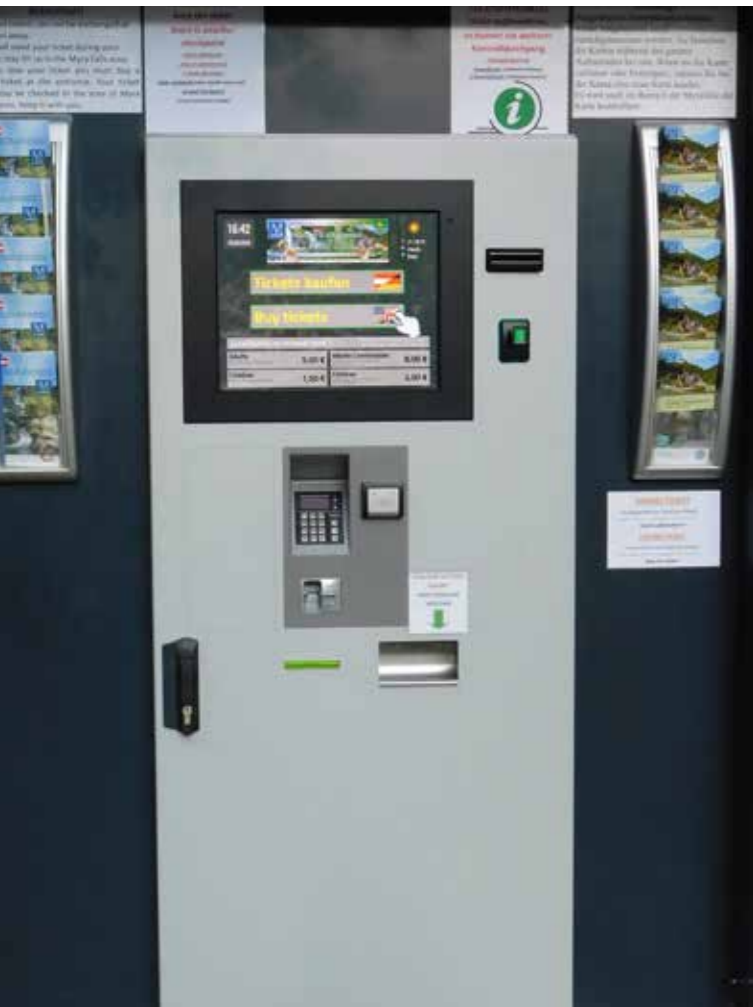
Self-Service-Kassen/Ticketautomat und robuste Scan-Station für den Außenbereich.

Beim niederösterreichischen Ausflugsziel Myrafälle werden die Spitzen des großen Besucherandrangs mit dem im Hause v4u entwickelten Self-Service-Kassenautomaten bewältigt. Damit werden bereits bis zu 30% der Ticketverkäufe mit einer intuitiven und einfachen mehrsprachigen Bedienoberfläche abgewickelt. Die ebenfalls von v4u entwickelten robusten Scan-Stationen bewähren sich dort täglich im rauen Außeneinsatz.