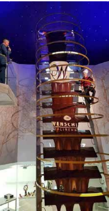
Eröffnung der Pralinenwelt bei der Firma Wenschitz in Allhaming mit modernem Zutritt zum Schaubetrieb und der Erlebniswelt.