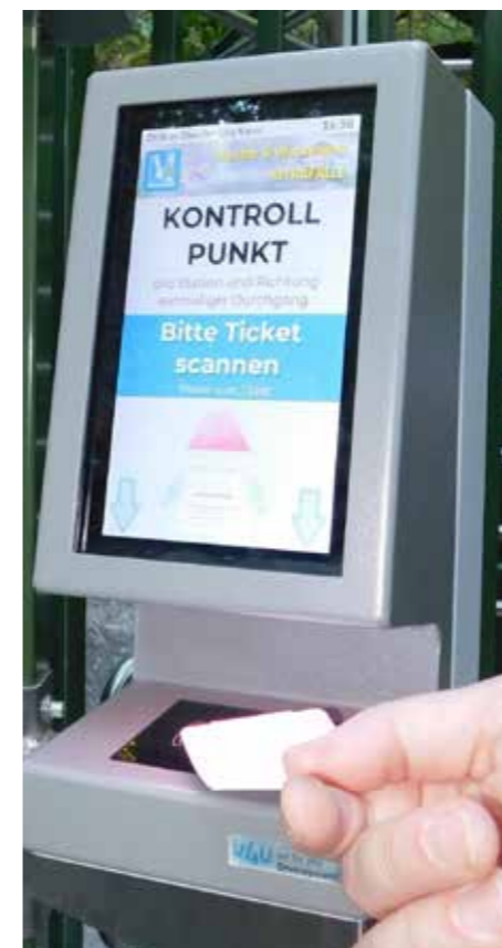
Robuste Zutrittsscanner für den Innen- und Außenbereich mit großem Display als Feedback für den Besucher.

Der Self-Service-Kassen/Ticketautomat aus dem Hause v4u ist so konzipiert, dass nicht nur die Tickets für Ausflugsziele gekauft werden können, sondern auch die Parkraumbewirtschaftung mit ein und demselben Ticket abgewickelt werden kann.